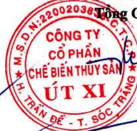
Lý Bích Quyên