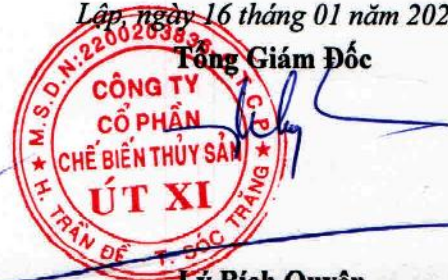
Lý Bích Quyền